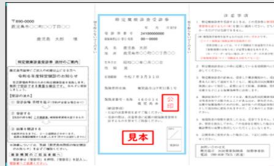
↑75歳未満の国保の方の受診券